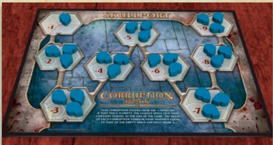
Пример подготовки счётчика коррупции