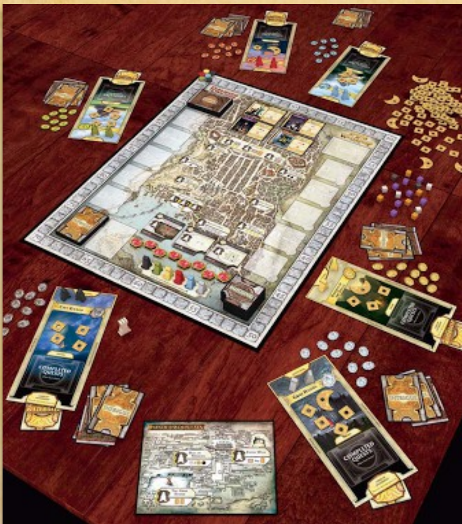
Подготовка к игре вшестером с модулем «Подгорье»

Выложите игровое поле «Подгорья» рядом с базовым, у каждого игрока должна быть возможность легко до него дотянуться. В остальном подготовка к игре проходит по обычным правилам.