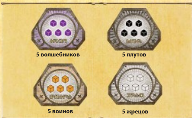
Жетоны отрядов искателей приключений

В состав дополнения входят 16 жетонов отрядов 4 типов, используйте их при игре с каждым модулем. Отряд — это 5 искателей приключений определённого типа. Если в общем резерве остаётся мало кубиков, меняйте своих искателей приключений на эти жетоны.