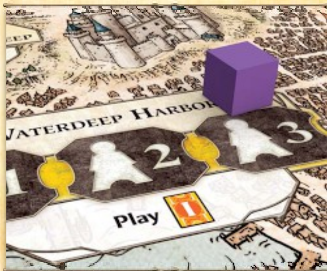
Мари кладёт 1 волшебника на 3-ю ячейку действия гавани Глубоководья (Waterdeep Harbor).

Вы можете выкладывать ресурсы на ячейки, занятые агентами, однако запрещается выкладывать их на здания Зала строителей (Builder's Hall).