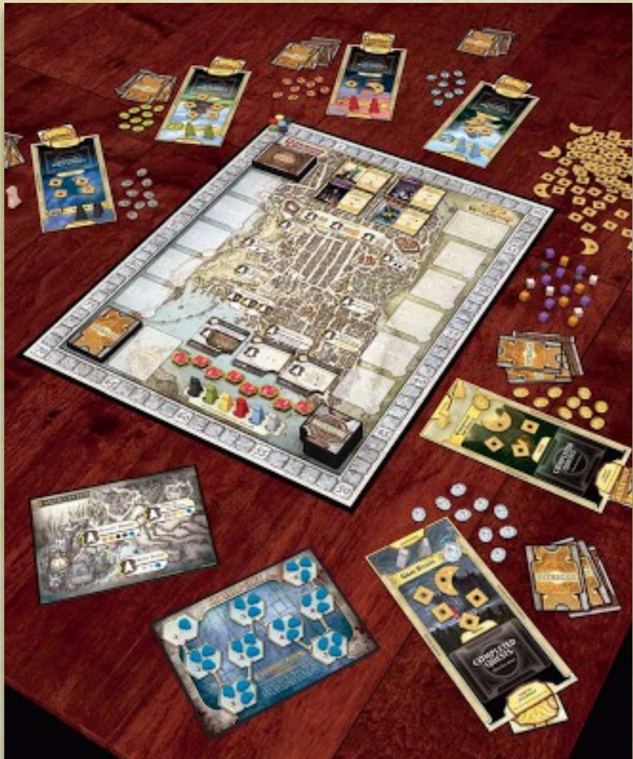
Подготовка к игре вшестером с модулем «Черепорт»

Выложите по 3 фишки коррупции на каждое деление счётчика от «-2» до «-9». Положите 1 фишку коррупции на деление «-1».