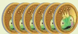
30 жетонов вкусняшек