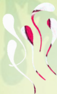
8 липких языков (включая 2 запасных)