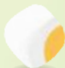
1 кубик цвета