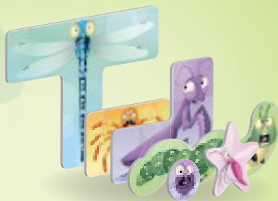
30 жетонов насекомых (по шесть пяти цветов)