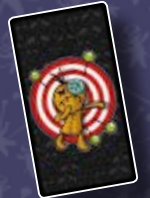
1 КАРТА ЦІЛІ