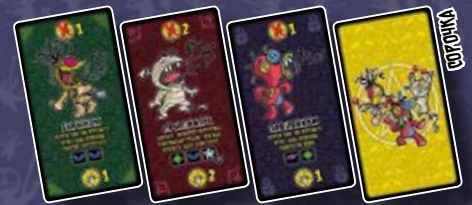
36 КАРТ ПРОКЛЯТЬ 12 КЕЛЬТСЬКИХ, 12 ЄГИПЕТСЬКИХ, 12 ГАЙТАНСЬКИХ