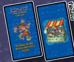
13 КАРТ АРТЕФАКТІВ