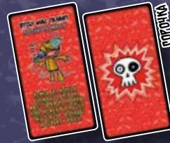
10 КАРТ ПОСТІЙНИХ ПРОКЛЯТЬ