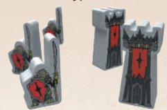
Воїни та фортеці Саурона