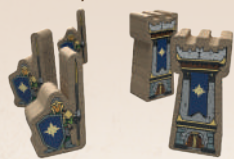
Воїни та фортеці Братства