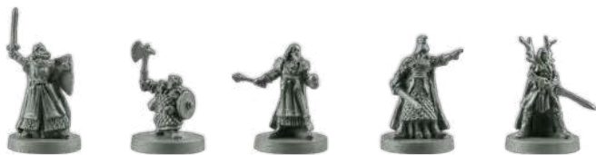
Бранд Даїн Денетор Теоден Грандуїл