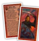
Тінь (3) Карти темних ватажків