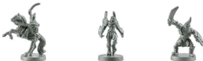
Чорна змія Тінь Морок-лісу Углук