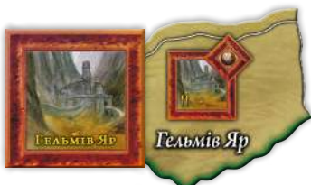
Гельмів Яр Плитки фортець Тіні