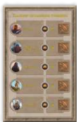
Планшет споганення суверенів