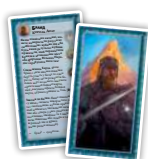
Вільні Народи (5) Карти пробуджених суверенів