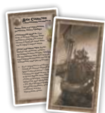
Вільні Народи (5) Карти споганених суверенів