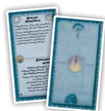
Вільні Народи (10)