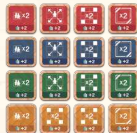
Плитки покращень x 16 (по 4 кожного кольору: червоні, блакитні, зелені, жовті)