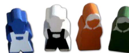
14 ФІГУРОК РОБІТНИКІВ