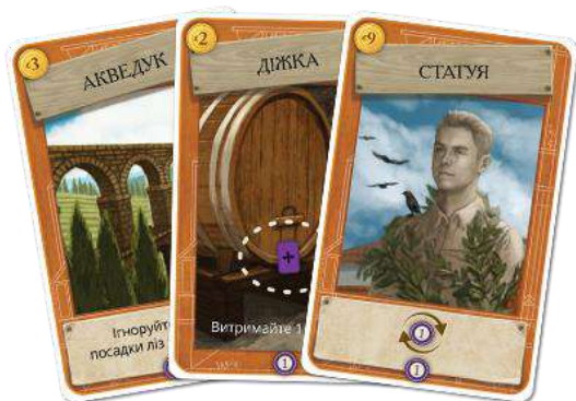
36 КАРТ СПОРУД