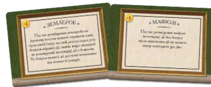
11 КАРТ СПЕЦІАЛЬНИХ РОБІТНИКІВ