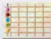
1 блокнот для підрахунку очок та олівець