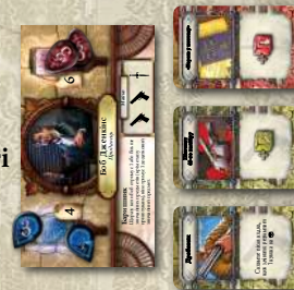
Ігрова зона дослідника