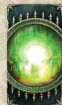
Колода Інших світів