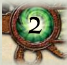
Карта пригод вартістю 2 трофеї

У деяких випадках гравець витрачає карту вартістю два або більше трофеїв на ефект, який коштує лише один трофей. Витрачаючи або втрачаючи трофеї в такий спосіб, гравець не отримує решти, усі невитрачені трофеї зникають.