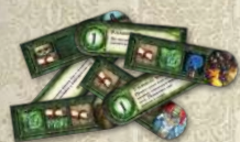
Жетони монстрів (чаша)