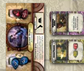
Ігрова зона дослідника