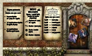
Лист входу в музей