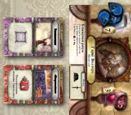
Ігрова зона дослідника