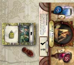
Ігрова зона дослідника