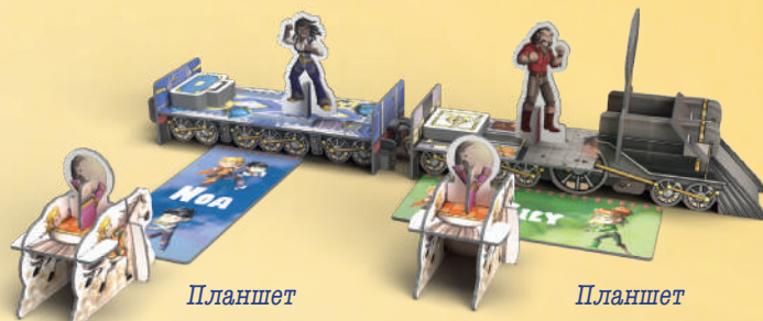
Планшет вертикально: складніша позиція

Перемістіть фігурку Сема. Подумайте, з якої позиції ви б хотіли стріляти (складнішої чи простішої) і скористайтеся своїм планшетом-пам'яткою, щоб розташувати Сема ближче до поїзда або далі від нього (див. малюнок нижче).