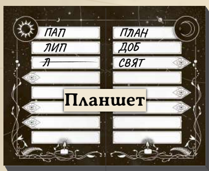
Сторона сонячної команди

Медіуми однієї команди мають спільну колоду карток, працюють разом і можуть ділитися таємними примітками. Кожен із них може промовити «Silencio».