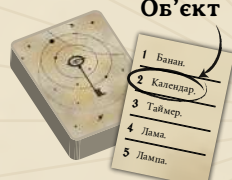
50 карток з об'єктами