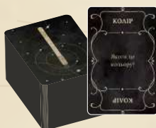
100 карток із запитаннями