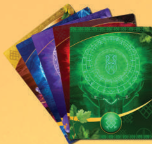
56 карт рун