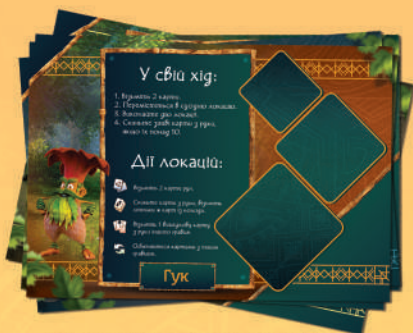
5 планшетів гравців