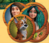
5 жетонів-пам'яток персонажів