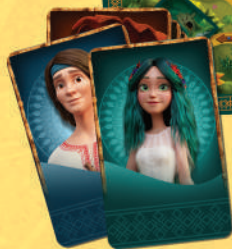
5 фігурок персонажів