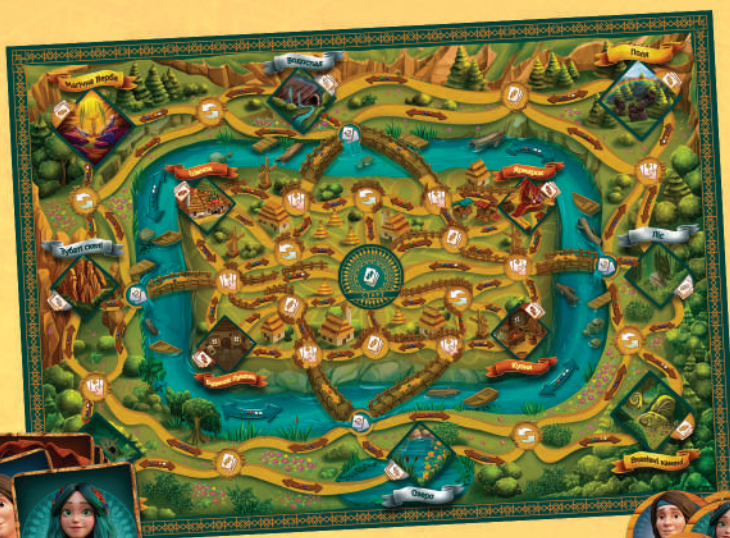
1 ігрове поле