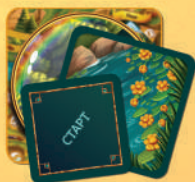
24 жетони цілей

(8 стартових жетонів — маленькі ромби, 8 жетонів другого етапу — середні ромби, 8 жетонів третього етапу — великі ромби)