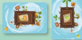
Приклад ділянок городу 2x2

Тепер перемішайте кожну з колод сезонів окремо одна від одної. Роздайте кожному гравцеві по п'ять карток із колоди весни. Потім візьміть картку сезону «літо» та замішайте її до десяти нижніх карток колоди весни. Замішайте картку «осінь» до десяти нижніх карток колоди літа, а картку «зима» – до десяти нижніх карток колоди осені. Протягом усієї гри три колоди відокремлено одна від одної, і на початку гри учасники можуть використовувати лише колоду весни. Покладіть картку сезону «весна» на стіл горілиць.