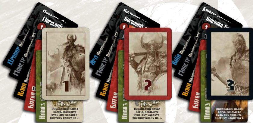
102 карти (3 колоди по 34 карти)