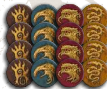
16 жетонів кланів (по 4 кожного клану)