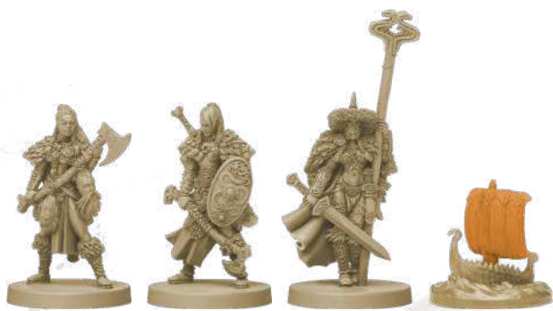
10 фігурок клану Змія (8 воїнів, 1 ярл, 1 дракар)