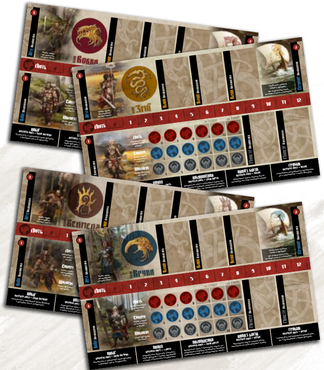
4 планшети кланів