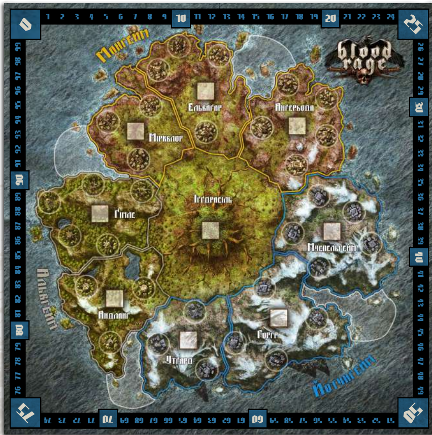
1 ігрове поле