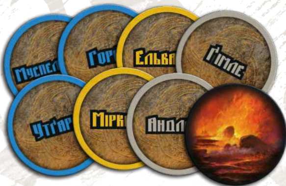
8 жетонів Рагнароку