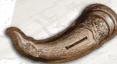
1 жетон першого гравця