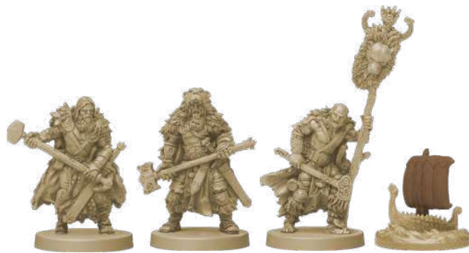
10 фігурок клану Ведмедя (8 воїнів, 1 ярл, 1 дракар)