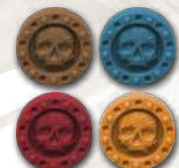
4 маркери очок слави (по 1 кожного клану)