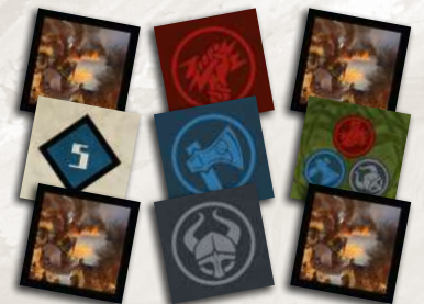
9 жетонів грабежу