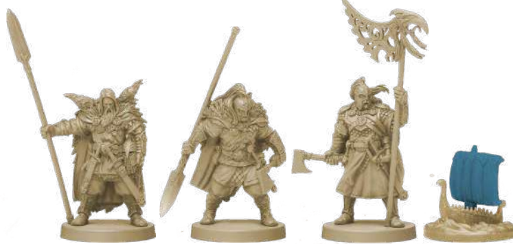
10 фігурок клану Крука (8 воїнів, 1 ярл, 1 дракар)