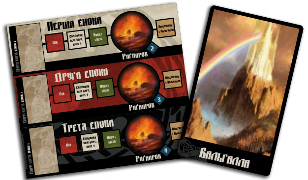
1 планшет епох