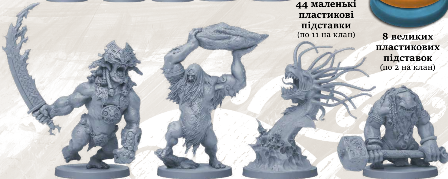
9 фігурок монстрів