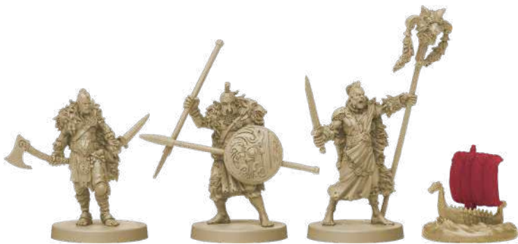
10 фігурок клану Вовка (8 воїнів, 1 ярл, 1 дракар)