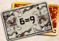
карти «ЩЕ ГОСТРИШЕ!»