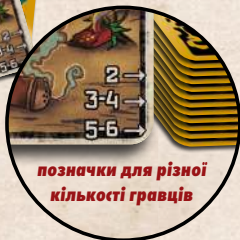
позначки для різної кількості гравців