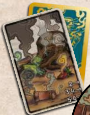
карта кінця гри