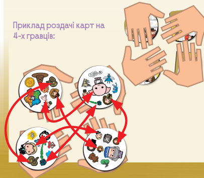
Приклад роздачі карт на 4-х гравців: