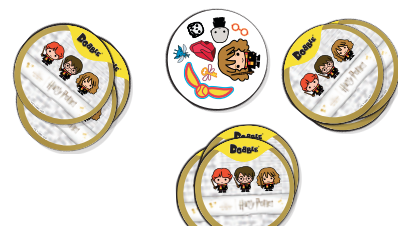
Приклад роздачі карт на 3-х гравців: