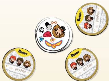
Приклад роздачі карт на 3-х гравців: