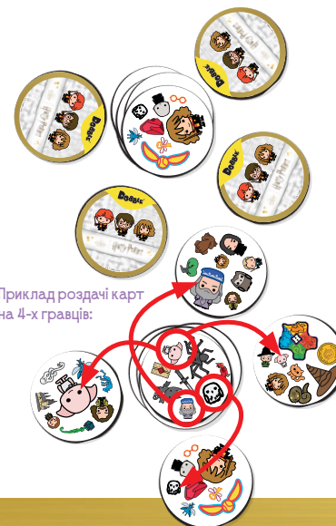
Приклад роздачі карт на 4-х гравців: