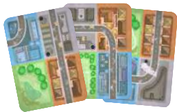
Рука першого гравця (не відкривати)